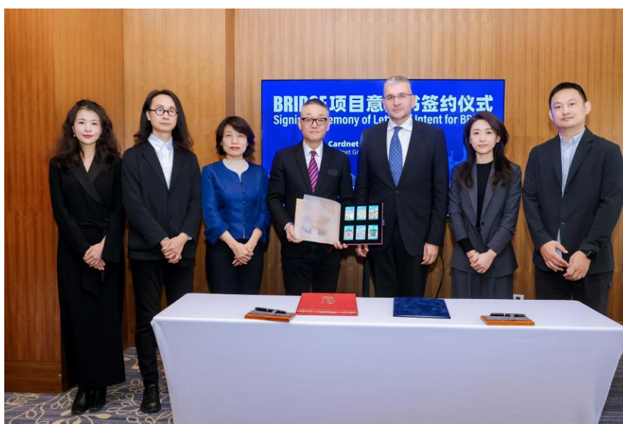
(澳门通集团控股有限公司赠送匈牙利 Cardnet Group 董事 Dr. János Kóka 世遗景点澳门通卡套装)

澳门通集团控股有限公司是一家业务多元化的集团公司，涉足金融科技、支付、本地生活服务、旅游服务和文化演出等多个领域。Cardnet Group 是匈牙利领先的数字支付集成商及服务供应商，主要为中欧、东欧及海湾地区的银行、零售商及商户的网络提供服务。通过 BRIDGE 项目，双方将发挥彼此优势，透过技术创新和系统集成，打造一个安全、高效的跨境支付体系。在支付场景上，BRIDGE 项目不仅将覆盖旅游业，为中国游客提供便捷的支付体验，亦逐步拓展至零售、交通、餐饮、票务及公共服务领域，全面覆盖线上与线下场景，并为本地商户提供数字化升级解决方案。