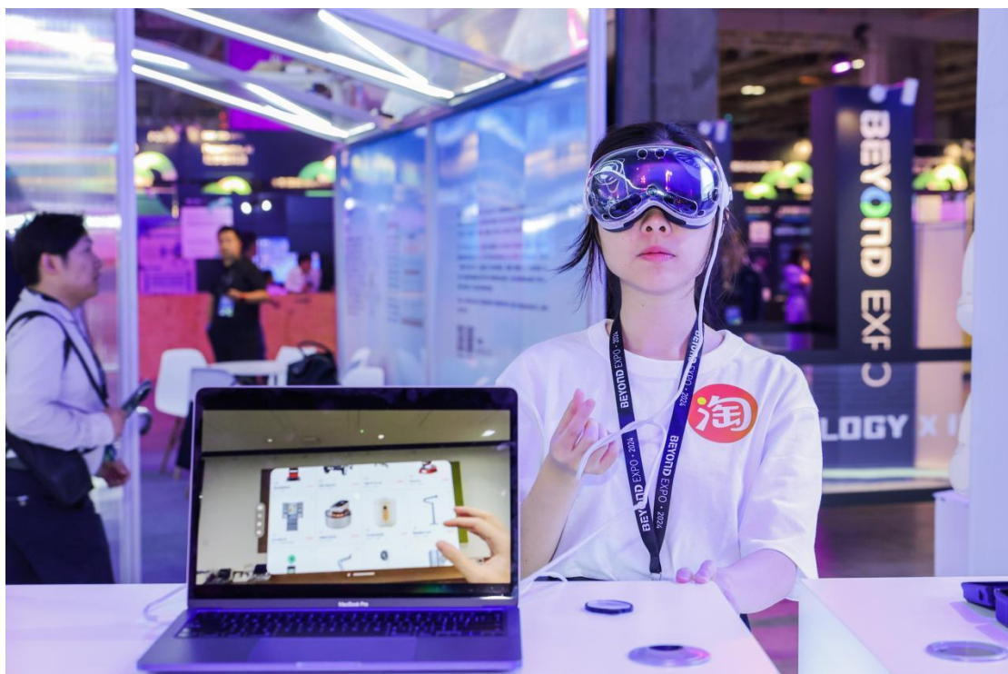
澳门通展位，淘宝 Vision 版带来了更极致的 MR 购物体验

澳门通与阿里巴巴、蚂蚁集团推进务实合作，积极拥抱产业数字化，各项业务取得持续创新、高质量发展的新成效：澳门通与蚂蚁国际联营支付宝（内地）与一系列东南亚钱包的跨境游专区（惠出境），为游客提供行前、行中和行后消费场景产品，让智慧旅游真正地落地到数字产业、服务到人；2024年2月推出飞猪联名澳门通卡，配合澳门特区政府“旅游+”跨界融合策略，为游客打造“吃喝玩乐行”一体的消费优惠便利体验，促进新增游客从线上流向线下消费场景，体验澳门文化。